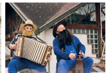
Kmečki punt - izven konkurence