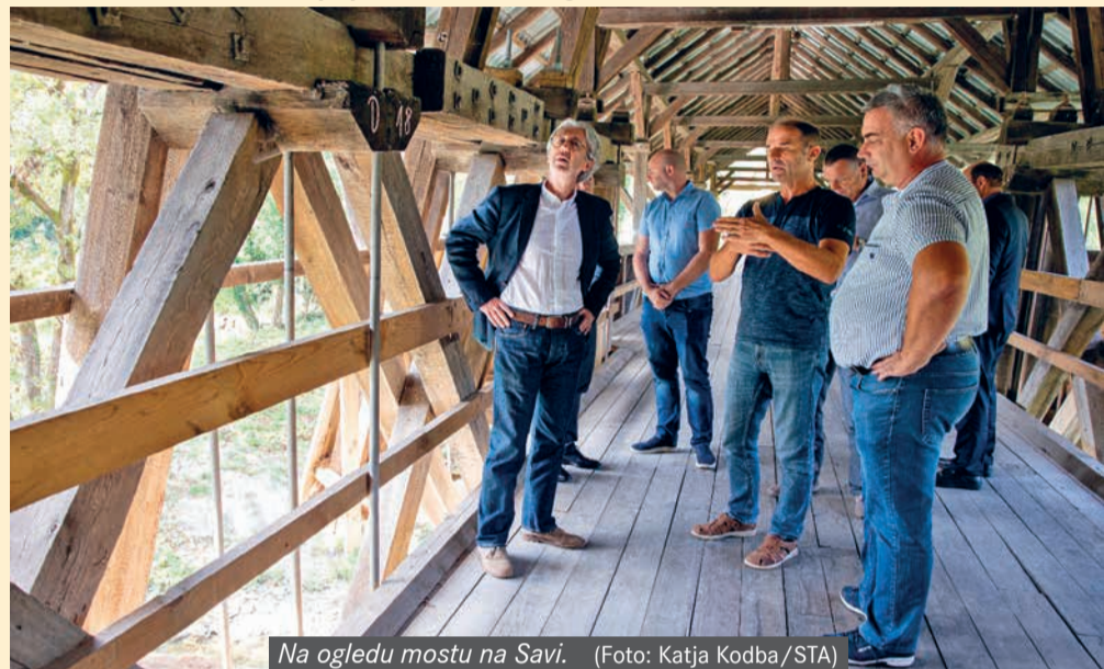
Na ogledu mostu na Savi.

Državni sekretar Boštjan Šefic se je v torek, 12.9.2023, srečal z županom Občine Litije Francijem Rokavcem. Delovni obisk je bil namenjen pogovoru o izzivih in potrebah občine in prebivalcev ter nadaljnjih ukrepih za pomoč. Župan je državnemu sekretarju uvodoma predstavil obseg poplav in vse dosedanje aktivnosti v okviru izvedbe intervencij ob katastrofalnih poplavah 4. in 5. avgusta 2023.