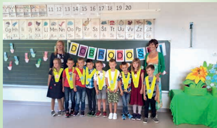
Devet prvošolčkov na POŠ Dole se je razveselilo prijaznega sprejema na prvi šolski dan.

Predstavniki Občine Litija so prvi šolski dan obiskali vse tri osnovne šole in zaželeli vsem, da bi se v »drugem domu« dobro počutili, predvsem pa varno in veselo prihajali k pouku.