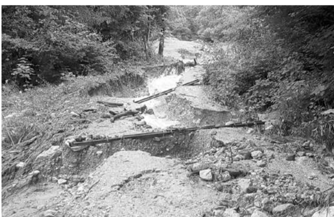
Do najnujnejše sanacije poškodb, je bila neprevozna tudi JP 708150 Globodol.

Ostale ceste na območju prizadetih KS so glede na poškodbe prej omenjenih cest utrpeli manjše poškodbe, predvsem kot lokalne zdrse zemljine in plazove večjih dimenzij, zamašenih propustov, odnešenih bankin in nanesenega materiala na cestišča.