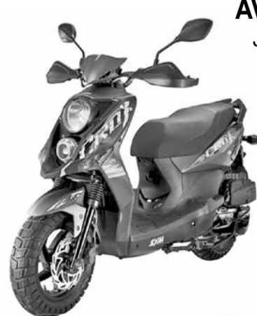
CROX 50 4T