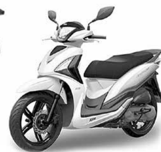
JET 4 4T